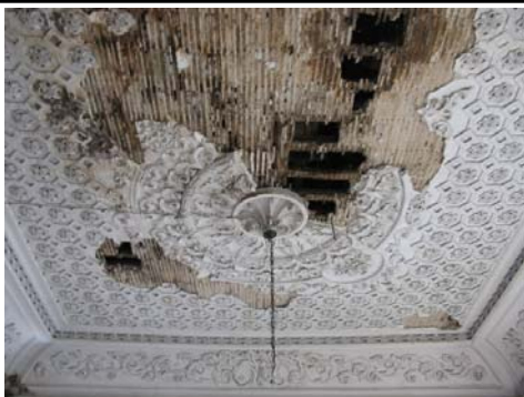
3 tectos trabalhados, pertencentes a diferentes divisões da casa