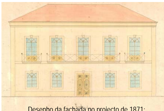
Desenho da fachada no projecto de 1871;

Inicialmente, fazia parte desta residência uma quinta que se estendia até aos terrenos onde actualmente se localiza a piscina municipal da rodovia, e que deu lugar aos prédios das ruas Padre Manuel Alaio, Orfeão de Braga, parte da rodovia e da Aldeia Olímpica.