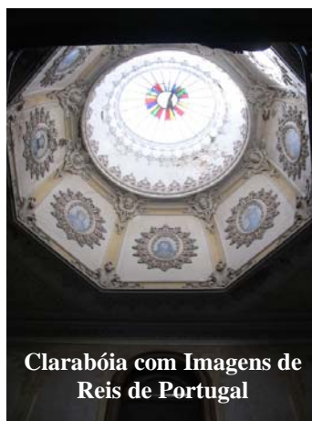
Clarabóia com Imagens de Reis de Portugal

Não se sabe em que ano foi construída, mas sabe-se que terá sofrido grande obras de remodelação e restauro no ano de 1871. Na fachada virada para a rua existem 9 janelas e a fachada das traseiras possui 11, todas elas com portadas. Em toda a casa existem 4 varandas.