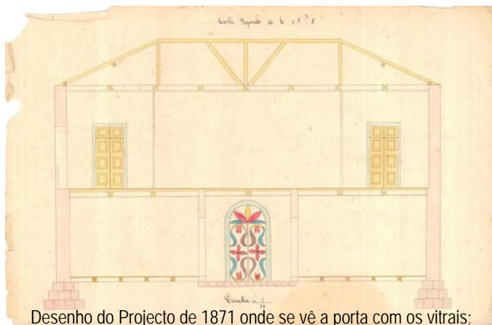
Desenho do Projecto de 1871 onde se vê a porta com os vitrais;

No seu interior, quase todos os tectos da casa são decorados com várias formas, dependendo das divisões. No hall de entrada, onde o pavimento foi retirado, existe também uma grande porta com "vitrais" que dá acesso à escadaria principal. Na zona da escadaria, as paredes são pintadas à mão e no topo existe uma clarabóia integrada num tecto incrivelmente decorado.