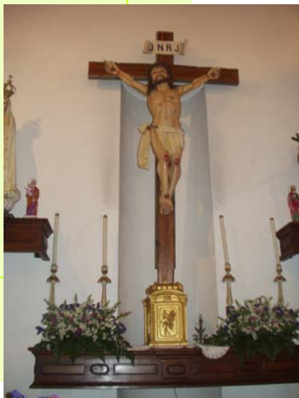
Imagem de Cristo Crucificado que se encontra dentro da Capela

Contudo, é nossa prioridade dar seguimento a esta linha de actividades, incentivando os nossos membros a conhecer, além de novas culturas, a cultura da sua própria região. Assim, cada vez mais apostamos na educação e sensibilização para o património construído, seja arqueológico, seja arquitectónico ou natural, da cidade de Braga e da região do Minho. Esperamos, desta forma, poder continuar a contribuir para a responsabilização dos nossos membros, educando-os e formando-os para uma vivência activa, participativa e orgulhosa no seio da sociedade onde se inserem..