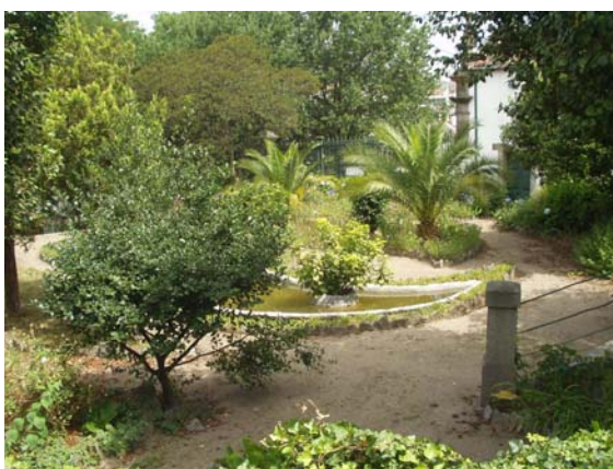
Vista do Jardim da Casa e Capela de Santa Tecla